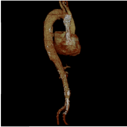
Abbildung 1: CT-Modell einer Aorta mit Stent

im speziellen Format "DICOM 2 " darstellt und Skalierungen sowie Rotationen erlaubt. Da der Fokus auf Funktionalität liegt, wird hier ein im Modell sichtbarer Zylinder, der längen- und durchmesserskalierbar ist, die örtliche Platzierung des Stents visualisieren.