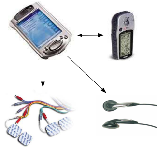
Abb. 1.1: Komponenten des Systems

Das GPS-Satelliten-System ist zur Zeit das funktionsfähigste und am weitesten verbreitete Positionsbestimmungssystem für Navigationshilfen, weshalb auch dieses zu entwickelnde System diese Technologie nutzen wird.