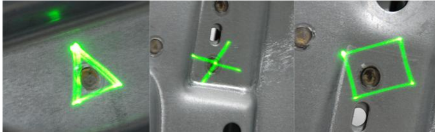
Abb. 2. Einfache abstrakte Augmented Reality Projektionen lassen sich auf den Karosserien darstellen, komplexere Informationen, die keiner Darstellung am Objekt bedürfen, werden auf einem separaten Monitor dargestellt.

können lange Texte nur schlecht lesbar auf eine Karosserie projiziert werden. Deswegen wird die Information dieses Systems in where-to-act und what-to-do aufgeteilt. Dabei beschreibt die where-to-act Information den Ort an dem agiert werden soll und die what-to-do Information die Handlungsanweisung an diesem Ort (in Form von Text oder Bild).